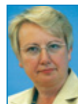
Annette Schavan, CDU

Persönliches: 54, ledig, promovierte Theologin, Honorarprofessorin Politische Ämter: seit 2005 MdB und Bundesministerin für Bildung und Forschung, davor zehn Jahre lang Kultusministerin in Baden-Württemberg und vier Jahre