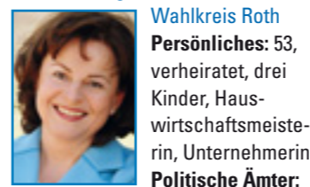
Marlene Mortler, CSU

Marlene Mortler, CSU, Lauf, Ortsteil Dehnberg, Direktkandidatin im Wahlkreis Roth