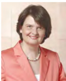
Dr. Maria Flachsbarth, MdB Präsidentin Katholischer Deutscher Frauenbund e.V.

Ich wünsche Ihnen eine angenehme Lektüre und motivierende Aspekte für die Verbandsarbeit!